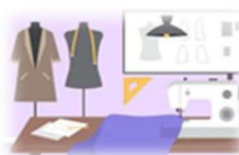
TAVOLO DA LAVORO