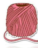
GOMITOLO DI LANA