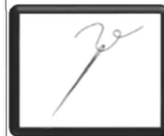
AGO E FILO