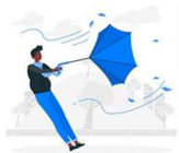
OMBRELLO DA RICICLARE