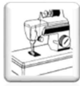
MACCHINA DA CUCIRE