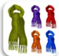
SCIARPE DI LANA