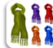
SCIARPE DI LANA