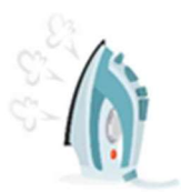
FERRO DA STIRO